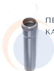
ПВХ ДЛЯ НАПОРНОЙ КАНАЛИЗАЦИИ