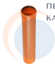
ПВХ ДЛЯ НАРУЖНОЙ КАНАЛИЗАЦИИ

На складе постоянный запас востребованной продукции из ПВХ и полипропилена, по Московскому региону доставка в кратчайшие сроки.