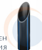
ПОЛИЭТИЛЕН НИЗКОГО ДАВЛЕНИЯ