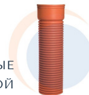
ДВУСЛОЙНЫЕ ГОФРИРОВАННЫЕ ТРУБЫ ДЛЯ НАРУЖНОЙ КАНАЛИЗАЦИИ